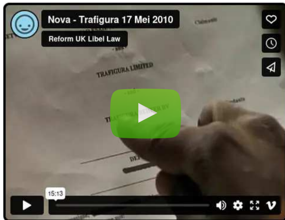
Vimeo | Tài xế Trafigura: “Chúng tôi bị hối lộ”

“ Người bình luận trên Vimeo: ‘Cảm ơn bạn, dù bạn là ai, vì đã cung cấp tài liệu này. Như bạn biết đấy, ở Anh chúng tôi không được phép đọc hay xem bất kỳ thứ gì trong số này.’”