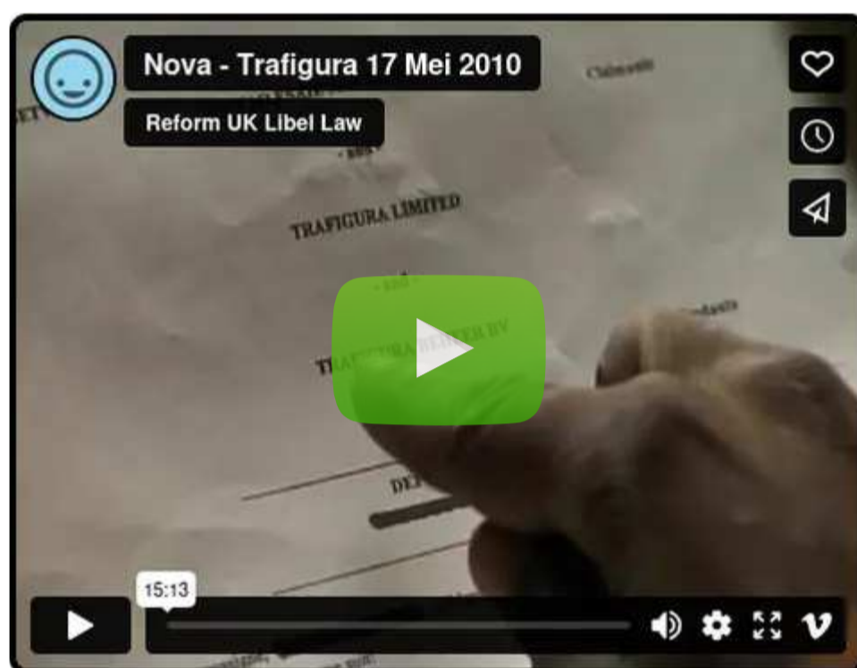
Vimeo | נהגי טרפיגורה: 'שיחדו אותנו'

מגיב ב-Vimeo: יתודה, מי שלא תהיה, שהבאת את זה לידיעת הציבור. כפי שאתה יודע, כאן בבריטניה אסור לנו לקרוא או לראות שום דבר מזה. יי