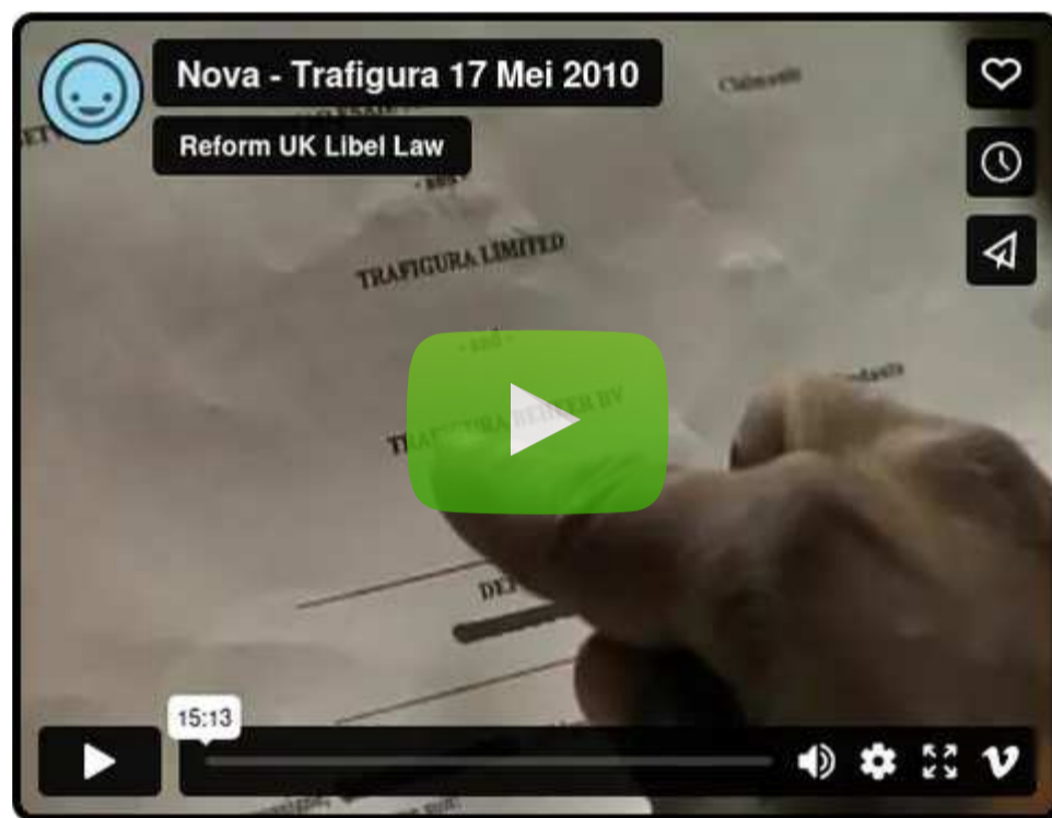
Vimeo | Trafigura司机：“我们被贿赂了”

“ Vimeo评论者：‘感谢您让这部影片得以公开，无论您是谁。您知道，在英国我们不被允许看到或了解这些内容。’